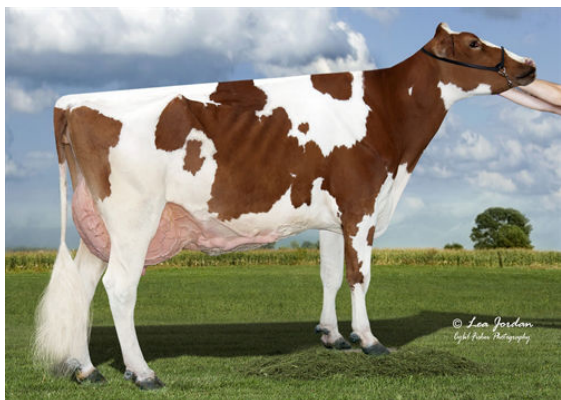
SCENERY-VIEW CELIA-RED FIFTH DAM